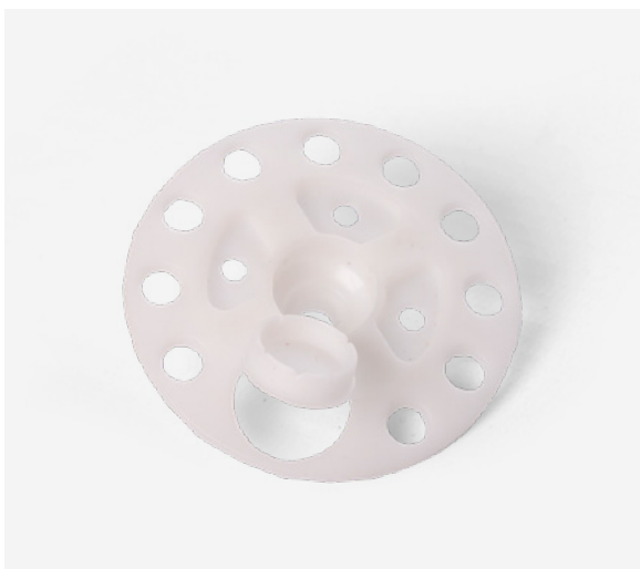
PIF isolatie schijf