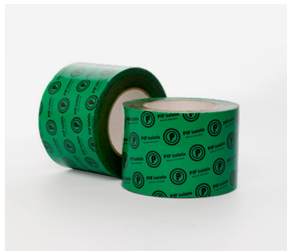
PIF luchtdichte tape 100 mm