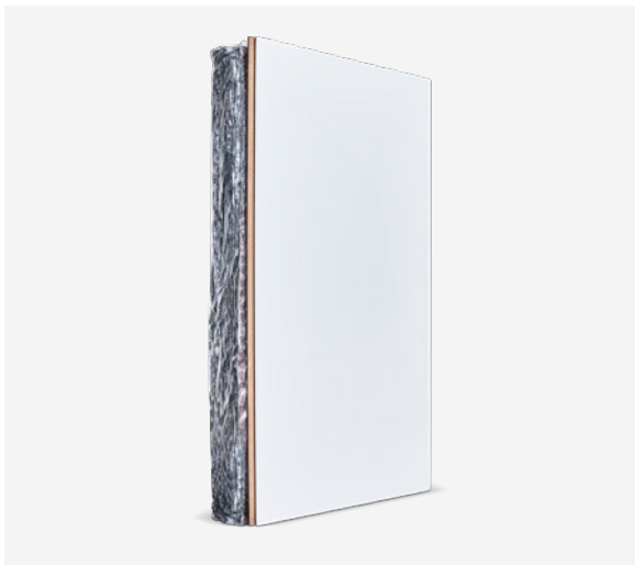
PIF Isofast MDF paneel